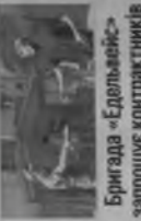
Бригада «Едельвейс» запрошує контрактників