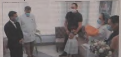
ПРЕЗИДЕНТ УКРАЇНИ Володимир Зеленський розпочав робочу поїздку безпечного перевезення новонародженого.