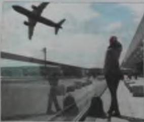
Молодь до 27 років