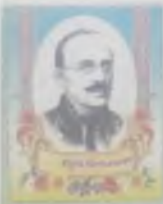
«Хочу бути з своїм краєм, хоч і буду з ним чужим, але ще завжди буду їм.»