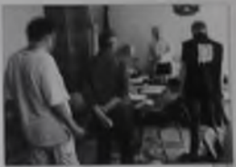
Членський збори на розробку статуту.